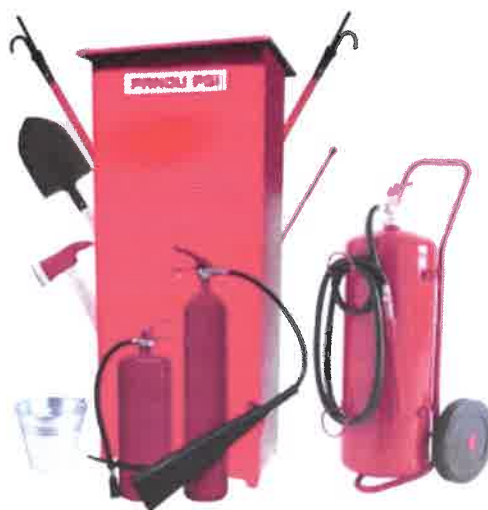
Fig. 5. Pichet PSI de exterior, complet echipat

Usa de acces la scara exteriora de evacuare va avea rezistenta la foc EI 15, cu urmatoarele caracteristici: