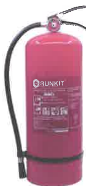
Fig. 4. Stingator portabil cu pulbere

In cladire se vor monta 6 bucati stingatoare portabile, cate 3 pe fiecare nivel al cladirii: