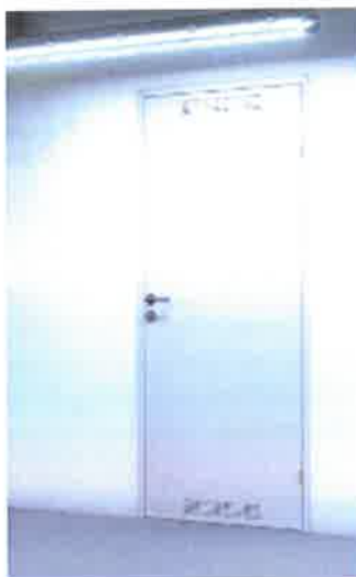
Fig. 3. Usa metalica cu foaie plina, montata la interior pe caile de evacuare

In cladire se vor monta 6 bucati stingatoare portabile, cate 3 pe fiecare nivel al cladirii: